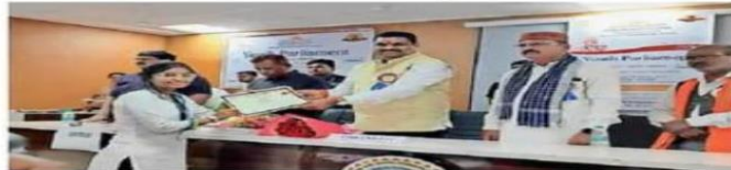
साइंस कॉलेज में हुए युवा संसद कार्यक्रम में छात्रों का सम्मान करते विधायक।